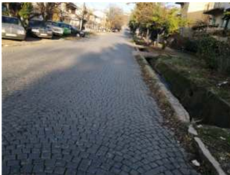
Слика 1 Моментална состојба на улица „Панче Караѓозов“

Вкупната должина на улицата е 400 m, а активностите за реконструкција ќе се одвиваат по целата должина. Ширината на улицата е 7 метри, со различна ширина на тротоарот, која се движи помеѓу 2 и 5 метри. Појдовната точка на реконструкцијата е на пресекот помеѓу ул. Панче Караѓозов и ул. Сутјеска, а крајната точка е 400 метри на северо-исток, на пресекот помеѓу ул. Панче Караѓозов и ул. 5-ти Конгрес. Постојната конструкција на улицата е од фина камена коцка 10/10/10 која на многу места е уништена. Од обете страни улицата има бетонски рабници кои се делумно оштетени на многу места. Постојните тротоари се со променлива ширина изработени од бетон и асфалт и се многу оштетени. На десната страна на улицата на десниот тротоарот е конструиран отворен бетонски канал за атмосферската вода. На улицата нема вграден канализациски систем со дренажни канали. На Слика 1 е прикажана моментална состојба на улица „Панче Караѓозов“.