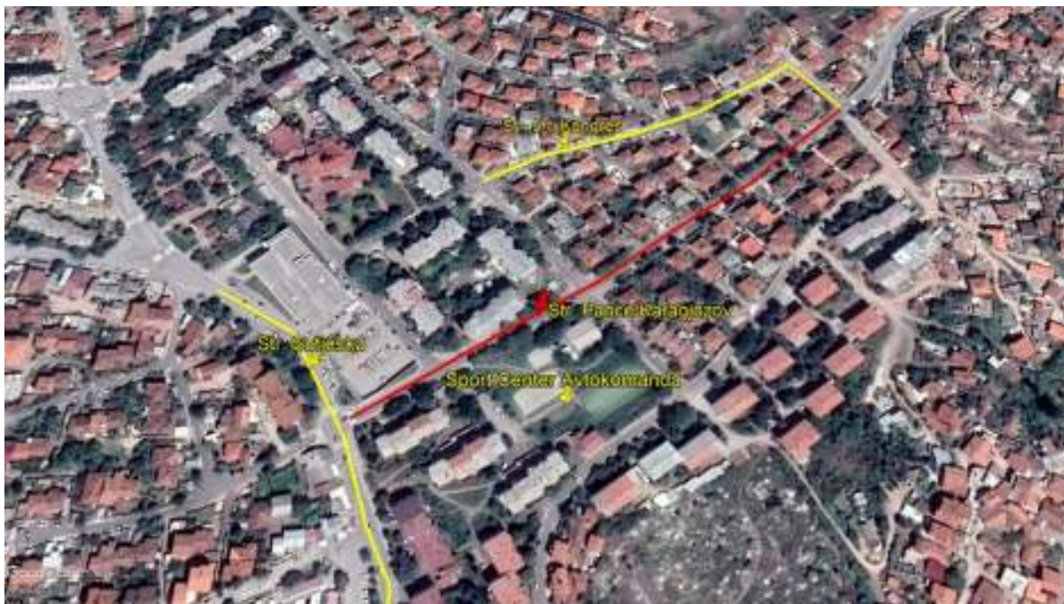
Слика 1 Локација на реконструкцијата на улица „Панче Караџов“